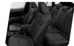
NỘI THẤT ĐEN