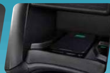
SẠC KHÔNG DÂY