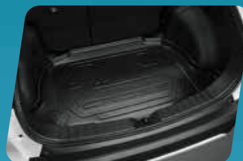
KHAY HÀNH LÝ