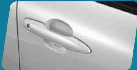
ỐP HỖM TAY VÂN CACBON (MÀU BẠC)