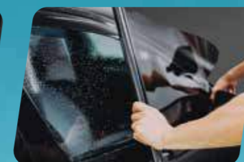
PHIM DÁN KÍNH