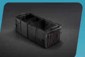
KHAY HÀNH LÝ GẤP GỌN