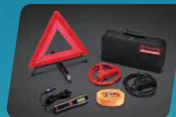
BỘ HỖ TRỢ KHẨN CẤP