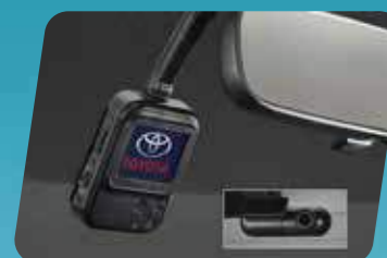
CAMERA HÀNH TRÌNH (GEN2)