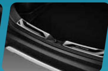
ỐP CHỐNG TRẦY CỘP SAU