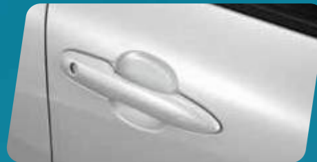
PHIM DÁN BẢO VỆ HỖM TAY NẮM CỬA