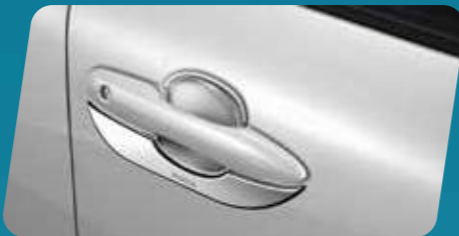
ỐP HỖM TAY NẮM CỬA (MÀ CRÔM)