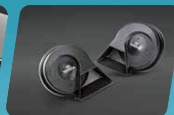
CÒI XE CAO CẤP