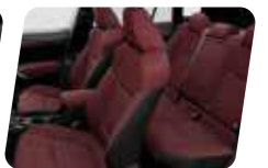
NỘI THẤT ĐỎ ĐẬM