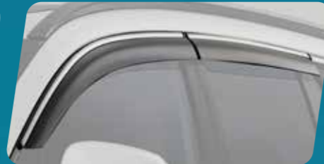
VỀ CHE MƯA (MÀ CRÔM)