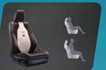
TỤA LŨNG GHẾ