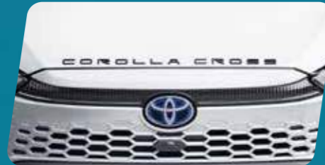
BIỂU TƯỢNG CHỮ COROLLA CROSS