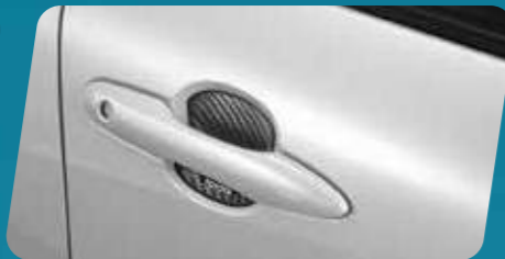
ỐP HỖM TAY VÂN CACBON (CAO SU)