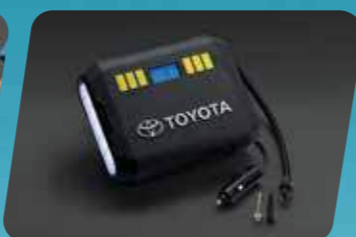
BƠM LỐP ĐIỆN TỬ