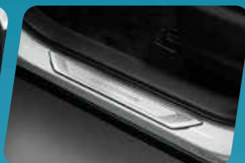
ỐP BẠC LÊN XUỐNG 4 CỬA